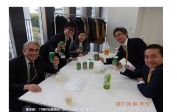
協賛の青島ビールで乾杯