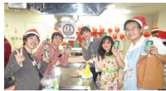
▲協賛の青島ビールを片手にパシャリ！

プレゼント交換は、各自予め五百円以内のプレゼントを用意して皆で交換するイベント。今年はトランプを用いてパートナーが決められた。トランプを一枚ずつ全員に配り、赤(ハート、ダイヤ)を女性に、黒(スペード、クロウバー)を男性に配り、同一番号の同士がプレゼントを男女ペアで交換した。プレゼントの中には