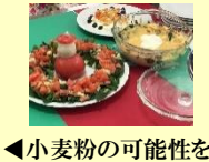
▲小麦粉の可能性を求めて