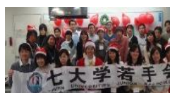
▲最後はみんなでパシャリ！