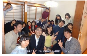
▲三次会も大盛り上がりで記念撮影!