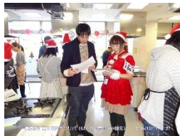
▲トレジャーハンティングで会場のサンタに質問

「ポケモンGO」や「君の名は。」に関する質問から、「うどん」は一家言あるからという一風変わった質問まで、楽しい会話で盛り上がった。そしてゲーム結果を元に、料理大会のチーム分けが行われ、運命共同体としてのチームの取り組みがスタートした。最初はぎこちなかった会場内が、一気に和やかな雰囲気になっていった。