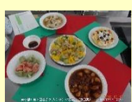
▲真夏のクリスマス