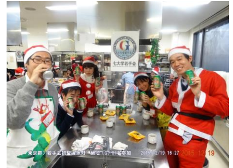
今回は青島ビール社の賛助を得た