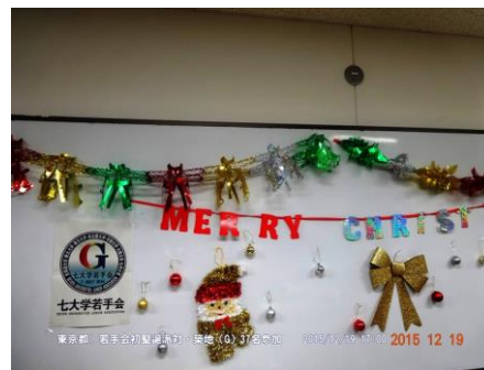
クリスマス色満点の会場