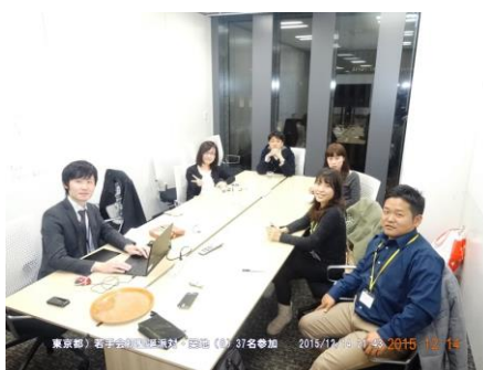
第2回幹事団打合せ：内容決定