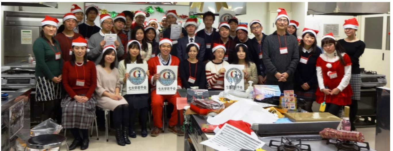
七大学若手会初主催の聖誕派對 (クリスマスパーティー) が 37 名のサンタの協力で大成功