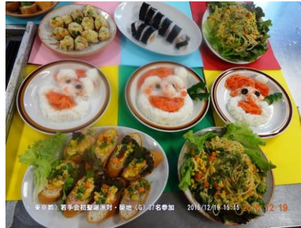
料理はレストランに負けない腕だ