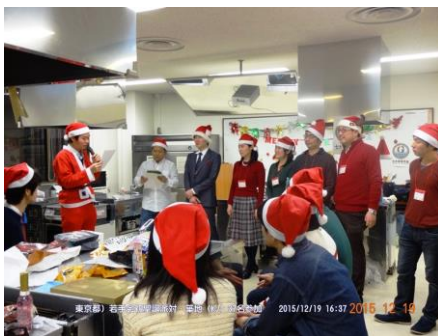
優勝チームに Jico 会長から表彰状