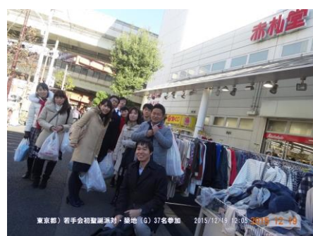
当日朝の幹事団買い出し