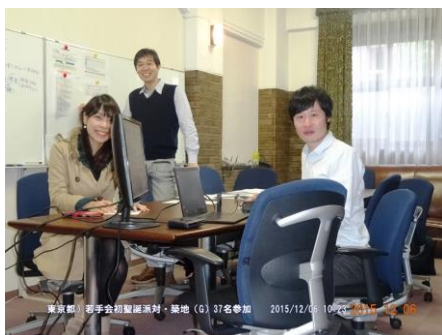
第1回の幹事団打合せ：コンセプト決定

七大学若手会経営陣一覧： http://wakatekai.jp/7UYMS.pdf