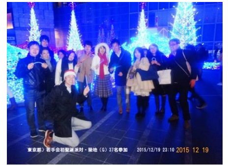
2 次会では汐留のイルミネーションも満喫