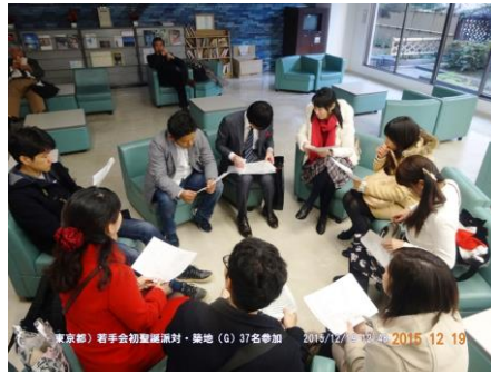
開催直前の幹事団最終確認会議