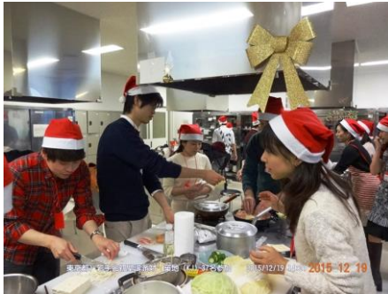
皆協力しあって調理作業を開始