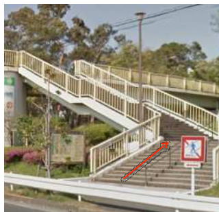
②歩道橋が見えたら歩道橋から夢の島公園に入ります。③夢の島公園バーベキュー場に向かいます。