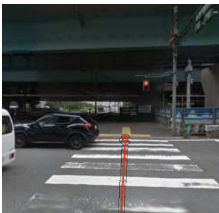
①「夢の島」の交差点を夢の島公園側に渡ります。

七大学若手会 SEVEN UNIVERSITIES JUNIOR ASSOCIATION