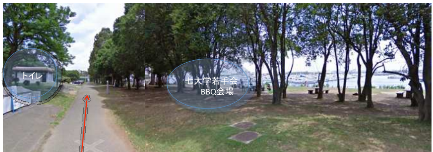
⑤七大学若手会BBQ会場はこの辺りです。