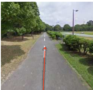
④まっすぐ夢の島公園バーベキュー場に向かいます。